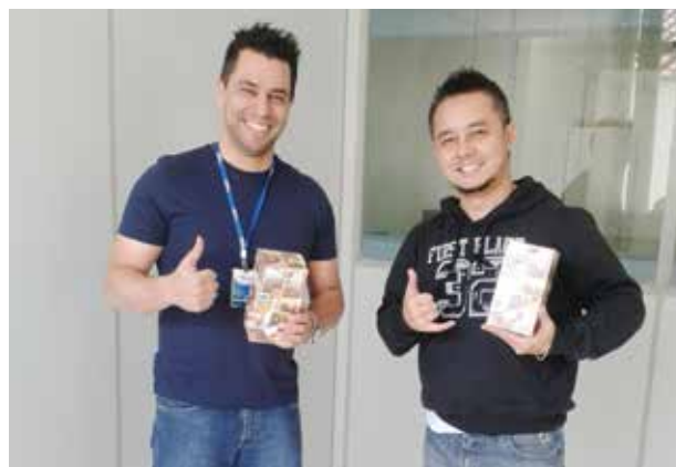
Colaboradores das unidades Contmatic em comemoração ao Dia dos Pais.