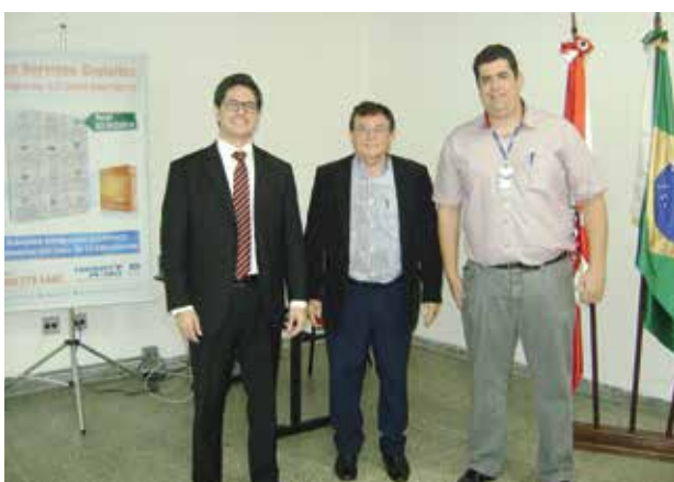
Palestra sobre Alterações na Legislação Tributária Federal e Estadual em 2014 realizada no dia 31/07/14 na Casa do Contabilista de Marília