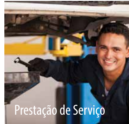
Prestação de Serviço