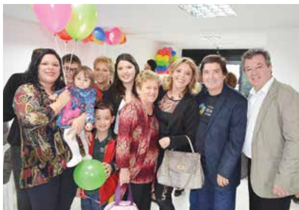
Colaboradores Contmatic marcam presença da inauguração da nova sede da Fundação Sérgio Conte