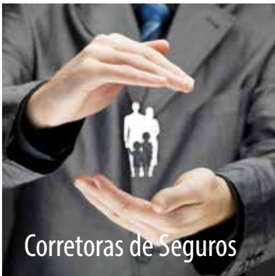
Corretoras de Seguros